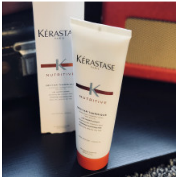
( https://smartstore.naver.com/main/products/3643378106 )