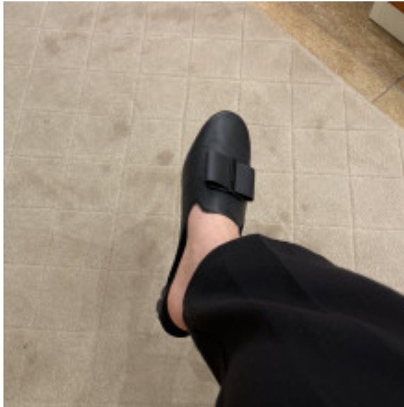
( https://smartstore.naver.com/main/products/5642789784 )

스마트스토어 WinLondon 5642789784 abcg**** 2021.06.16 16:26