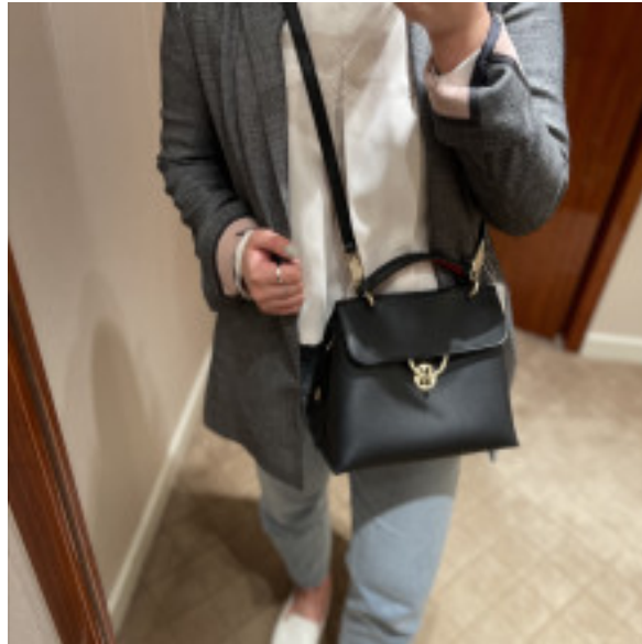
( https://smartstore.naver.com/main/products/5649675483 )

응대불만으로 취소요청하니까 역시나 이제서야 몇일전부터 이동중인 실출고 송장을 바로 입력했네요!!!!!!