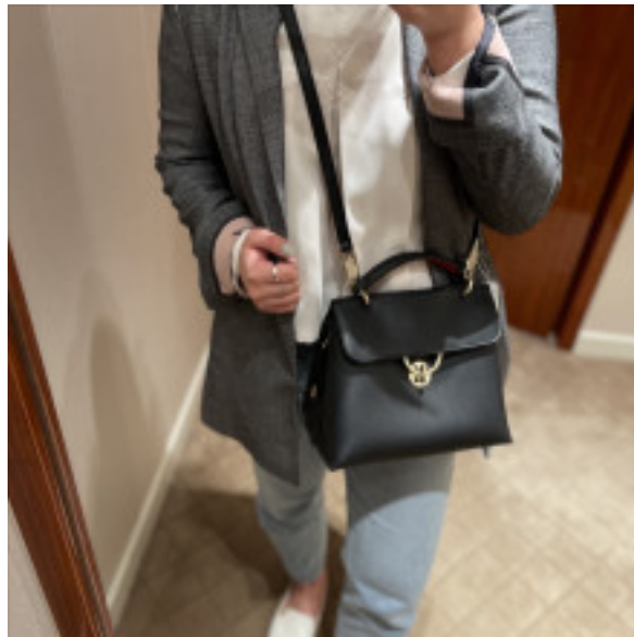
( https://smartstore.naver.com/main/products/5649675483 )

[영국아울렛] 페라가모 JET SET 플랩 토트백 0685065 24X19 (블랙)