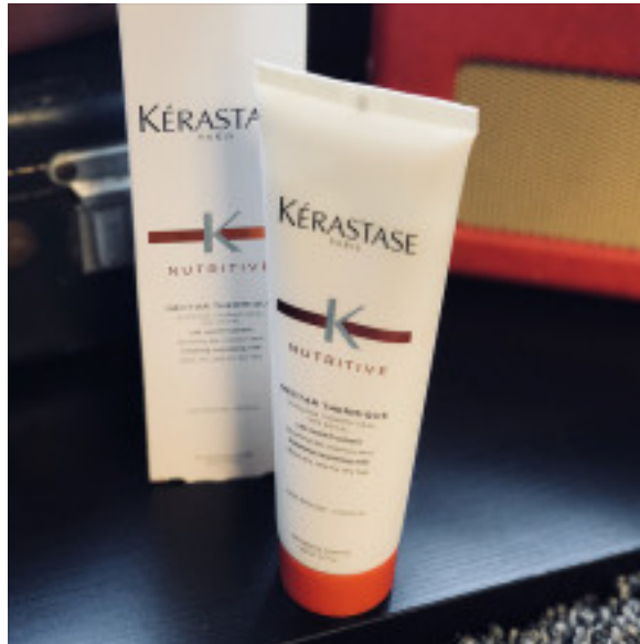
( https://smartstore.naver.com/main/products/3643378106 )