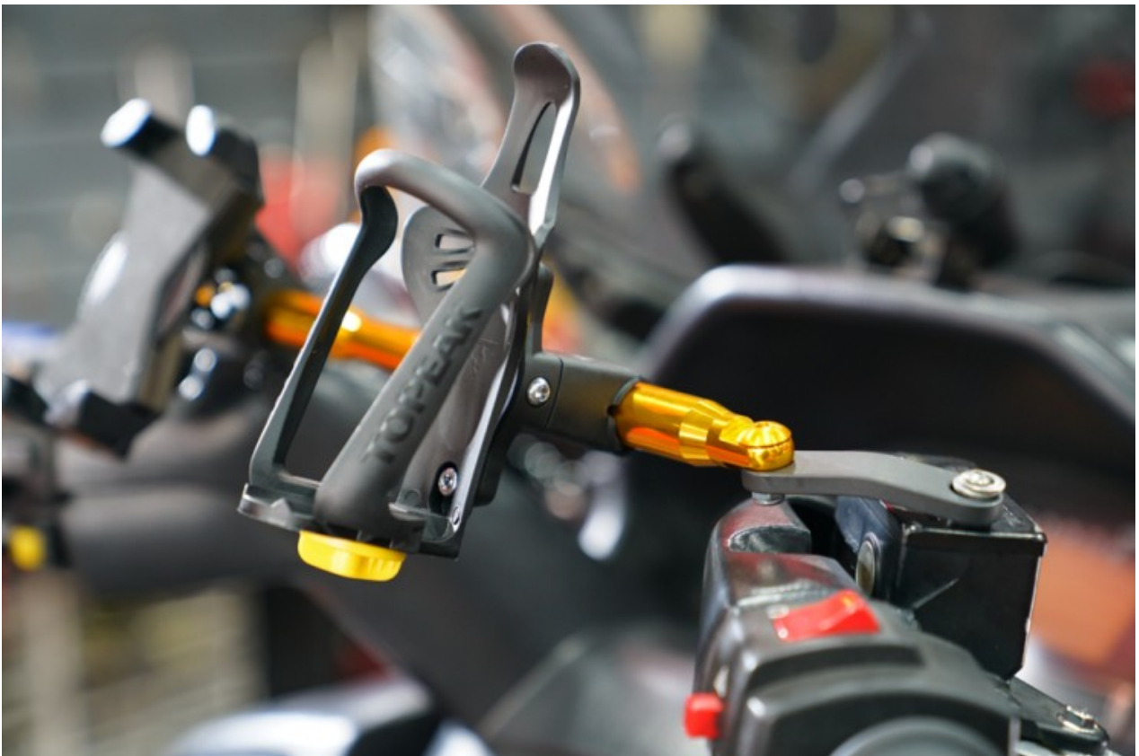
이건 대만제 물병 거치대의 모습입니다. 위 상품은 공장 직영 제품과 OEM(자전거용) 제품이 있는데 결속 강도나 거치대의 내구성이 다르기 때문에 유사품과는 구별을 하셔서 구매하셔야 합니다.