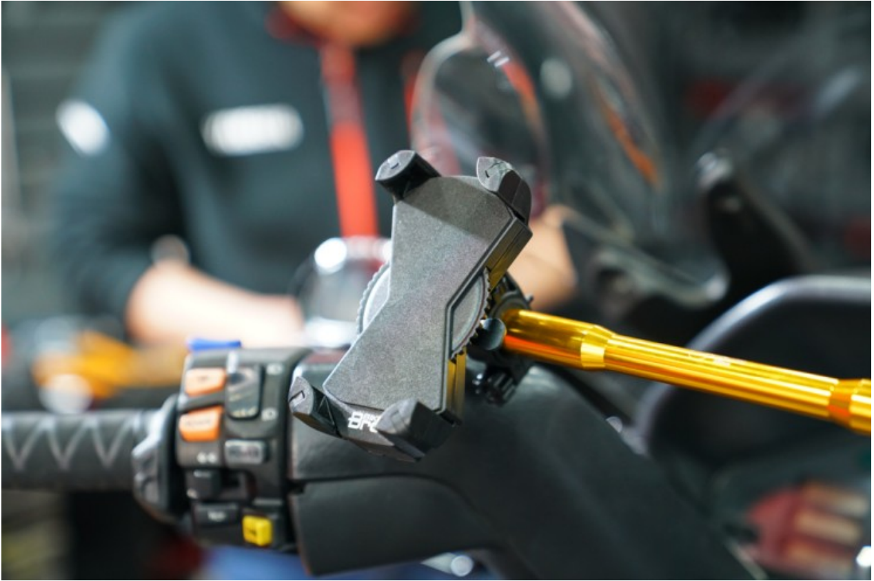
거치가 완료된 범용 핸들바에 바이크 브로스 폰 거치대가 올라간 모습입니다.