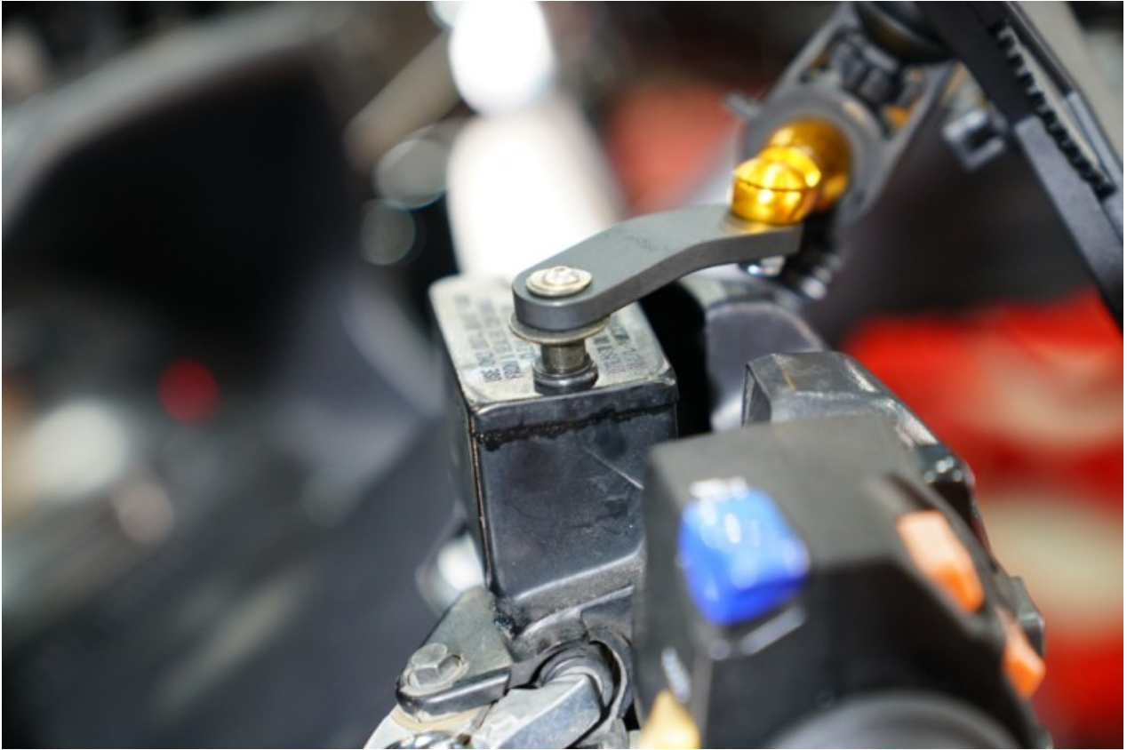
사진과 같이 부속물을 이용해 핸들바를 올리게 됩니다. 다만 신형 버그만 이보단 조금 더 깔끔하게 거치가 됩니다.

이상으로 성남 에스바이크에서 범용 핸들바 스테빌라이저에 대한 버그만650 장착하였습니다.