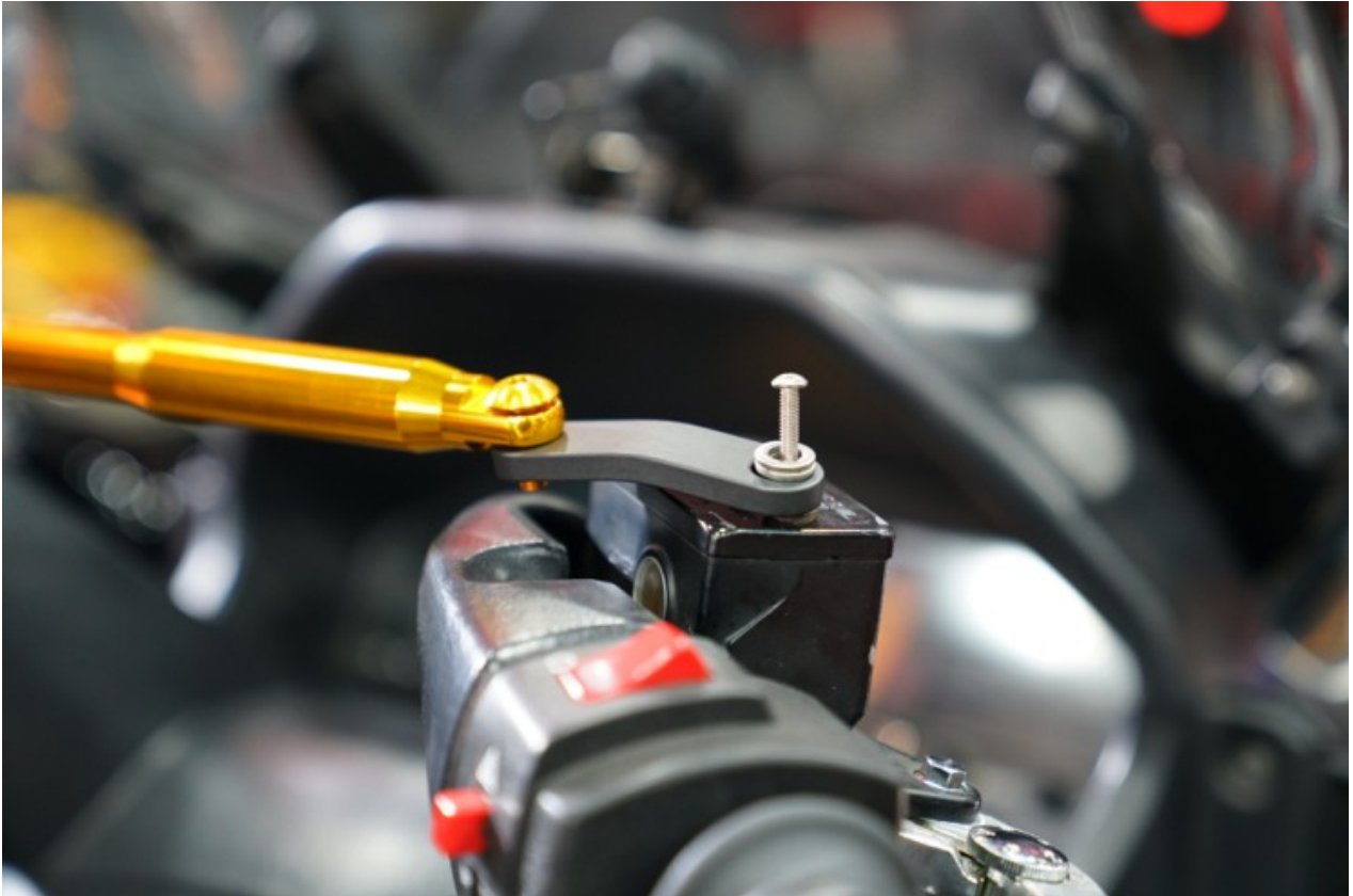
보통은 스쿠터들의 백미러 결합 나사 자리를 이용해 장착되지만 본 차량은 그러한 옵션 공간이 없기 때문에 위 사진과 같이 마스터 실린더캡 상부의 나사를 이용해 걸 어주게 되었습니다. 나사도 별도로 긴것이 필요하고 이에 맞는 여분의 부싱도 필요합니다. 허나 에스바이크 방문하셔서 장착하시면 공임 외 추가로 들어가는 부속들은 무상으로 공급 및 장착해드리고 있습니다.