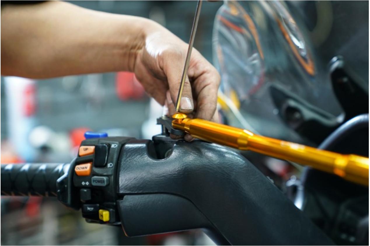
다만 위 상품은 본 차량 전용 핸들바는 아닙니다. 범용으로 나온 상품으로 10종류의 스쿠터가 있다면 이에 장착 시 5대는 순정 그대로 장착이 가능한 반면 이날 같이 버그만650엔 약간의 임가공과 추가적인 부속을 덧방해야 올리 수 있습니다. 해서 가공까진 아니더라도 개인이 하시기엔 무리가 있습니다.